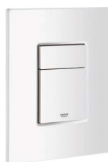
OVLÁDACÍ TLAČÍTKO WC GROHE

Praktické ovládací tlačítko, bílé, pro předstěnové instalační systémy a WC nádrže na zadržení. Dvojitelné mechanické splachování.