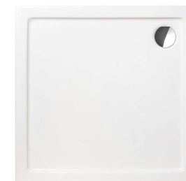
SPRCHOVÁ VANIČKA ROTH

Akrylátová vanička je vyztužena sklolaminátovou vrstvou, s nízkou nástupní hranou - jen 5 cm a se snadnou údržbou.