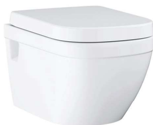
ZÁVĚSNÉ WC GROHE

Závěsné WC se zadním odpadem a se splachovacím okruhem. Objem splachování je 3/6 litru.