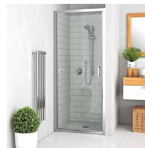
SPRCHOVÁ ZÁSTĚNA ROLTECHNIK

Polorámové sprchové dveře do niky s hliníkovými profily, tvrzené sklo, hliníkové rámové provedení, nerezové madlo.